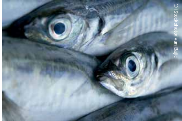
Η ΕΕ προωθεί τη βιώσιμη αλιεία.

Σε διεθνές επίπεδο και μέσω των διμερών της σχέσεων, η ΕΕ προωθεί τις αρχές της βιώσιμης αλιείας, της προστασίας της βιοποικιλότητας και της χρηστής διακυβέρνησης, και τις προβάλλει σε παγκόσμια κλίμακα. Στην ΕΕ οφείλεται η αποκατάσταση των αποθεμάτων ερυθρού τόνου και η καταπολέμηση της παράνομης αλιείας σε παγκόσμιο επίπεδο. Ειδικότερα, όσον αφορά την παράνομη αλιεία, η ΕΕ αξιοποιεί όχι μόνο το πολιτικό της βάρος αλλά και το βάρος της αγοράς της, απαγορεύοντας την εισαγωγή προϊόντων που δεν συμμορφώνονται με τα διεθνή πρότυπα.