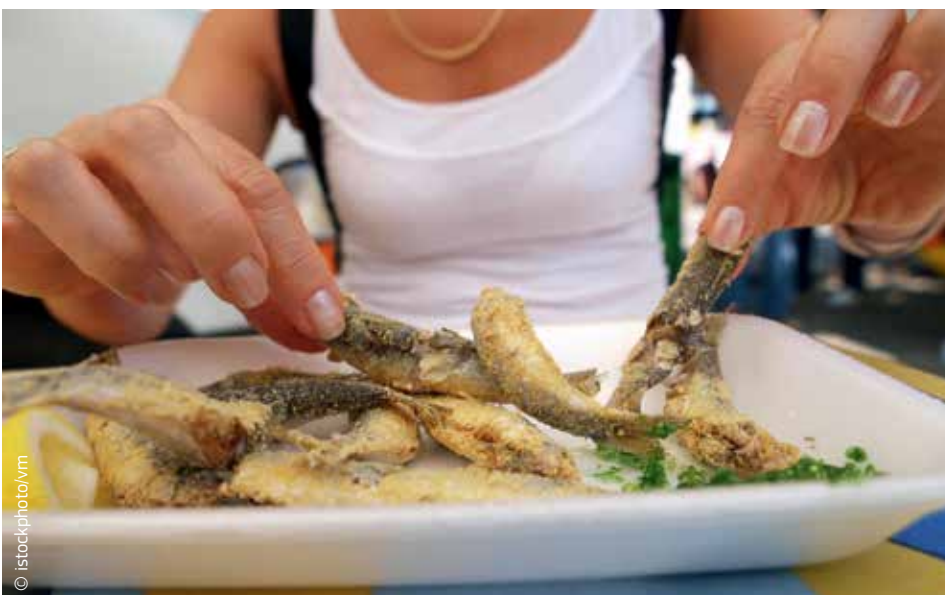
Η ζήτηση για ψάρια και θαλασσινά αυξάνεται συνεχώς.

Ωστόσο, το Ταμείο δεν είναι απλώς ο καταλύτης για βιωσιμότητα και καλές οικονομικές επιδόσεις. Είναι επίσης ένα εργαλείο για την υλοποίηση της κοινωνικής ατζέντας της Επιτροπής. Οι σύζυγοι, που συχνά παίζουν ενεργό ρόλο στις οικογενειακές αλιευτικές επιχειρήσεις, θα μπορούν να λαμβάνουν στήριξη για κατάρτιση ή άλλες οικονομικές δραστηριότητες που συνδέονται με την αλιεία. Παράλληλα, στηρίζονται οι οργανώσεις παραγωγών να σχεδιάζουν την παραγωγή τους και να εμπορεύονται τα προϊόντα τους με τρόπο που να ανταποκρίνεται στις προσδοκίες ενός όλο και πιο ενημερωμένου καταναλωτικού κοινού.